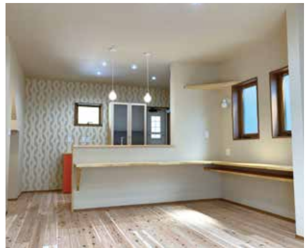
動線を考えたリビング