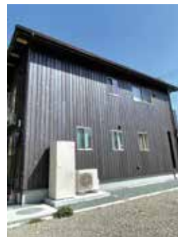
省エネエコキュート