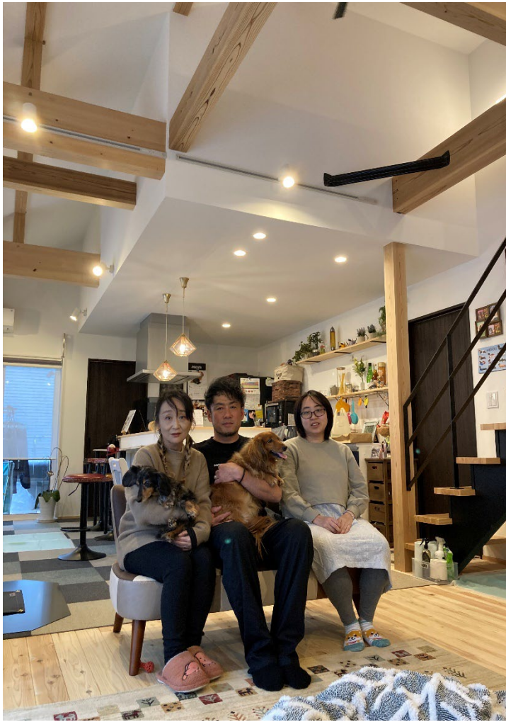
W様ご家族、愛犬とともに