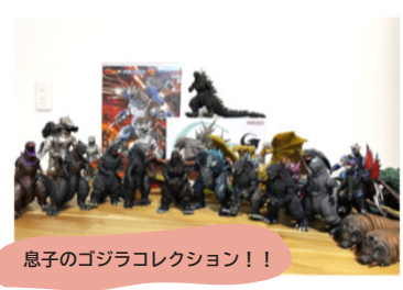
息子のゴジラコレクション！！

仕事は、ひとつひとつを丁寧に！お客様に喜んでいただけるよう取り組みます。そして藤川工務店のファンを増やしたいです。子育ては、楽しく！全力で！子どもたちと向き合いたいです。