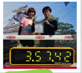
龍馬マラソン2024完走

息子たちと一緒に遊ぶことが一番の楽しみです。週末は、県外の公園に遊びに行ったり、イベントに参加したり、映画を観たりしています。ゴジラ好きの息子たちのリクエストで、『ゴジラ -1.0』は映画館で2回観ました。健康維持の為、去年から平日朝ランを始めました。毎月100km以上は走るようにしています。先日の高知龍馬マラソン2024にも出場し、無事完走しました。初めて42.195km走ったので、ゴール後うろうろしていると、両足がつって大変でした。