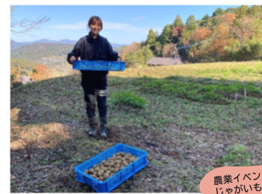
農業イベント じゃがいも堀り準備中

日々の些細な目標でも、中長期的な大きな目標でも成し遂げることができるとやりがいを感じます。