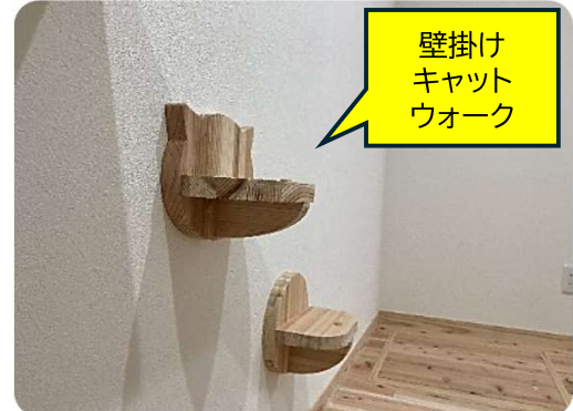
壁掛け キャット ウォーク